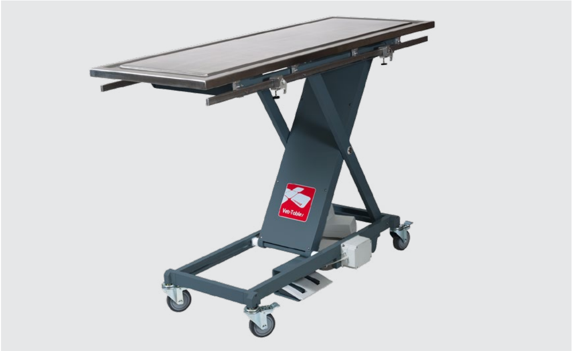
Table servant à de nombreuses utilités

Chaque fois que vous avez besoin d'une civière ou une aide supplémentaire pour soulever un chien lourd ou effectuer une intervention chirurgicale, la table à ciseaux est idéale pour vous aider à accomplir vos tâches quotidiennes.